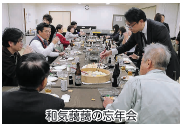
和気藹藹の忘年会