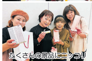
たくさんの景品にニッコリ