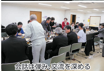
会話は弾み、交流を深める