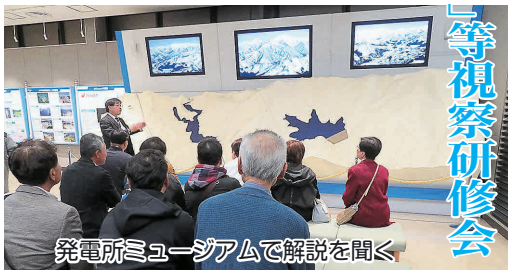
発電所ミュージアムで解説を聞く

11月15日(金)から16日(土)にかけて、研修親睦交流委員会の呼びかけの下、工業会との合同視察研修会が開催されました。初日は新潟県湯沢町の奥清津発電所で日本最大級の揚水発電を視察し、二日目は高級爪切りで有名な諏訪田製作所の工場を見学しました。会員どうしの親睦がグッと深まった楽しい二日間でした。